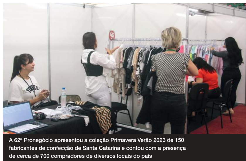
A 62ª Pronegocio apresentou a coleção Primavera Verão 2023 de 150 fabricantes de confecção de Santa Catarina e contou com a presença de cerca de 700 compradores de diversos locais do país

Com o encerramento da 62ª Pronegocio, a AmpeBr inicia os preparativos para a próxima rodada, que acontece de 14 a 17 de agosto, e apresenta as coleções de Alto Verão 2023/2024. O evento novamente será exclusivo para lojistas e fabricantes catarinenses. Mais informações e inscrições: (47) 3351-3811. Além disso, a partir de agora, a diretora da AmpeBr passa a organizar as próximas prospecções, de convites a novos lojistas e fabricantes para as edições seguintes da Pronegocio.