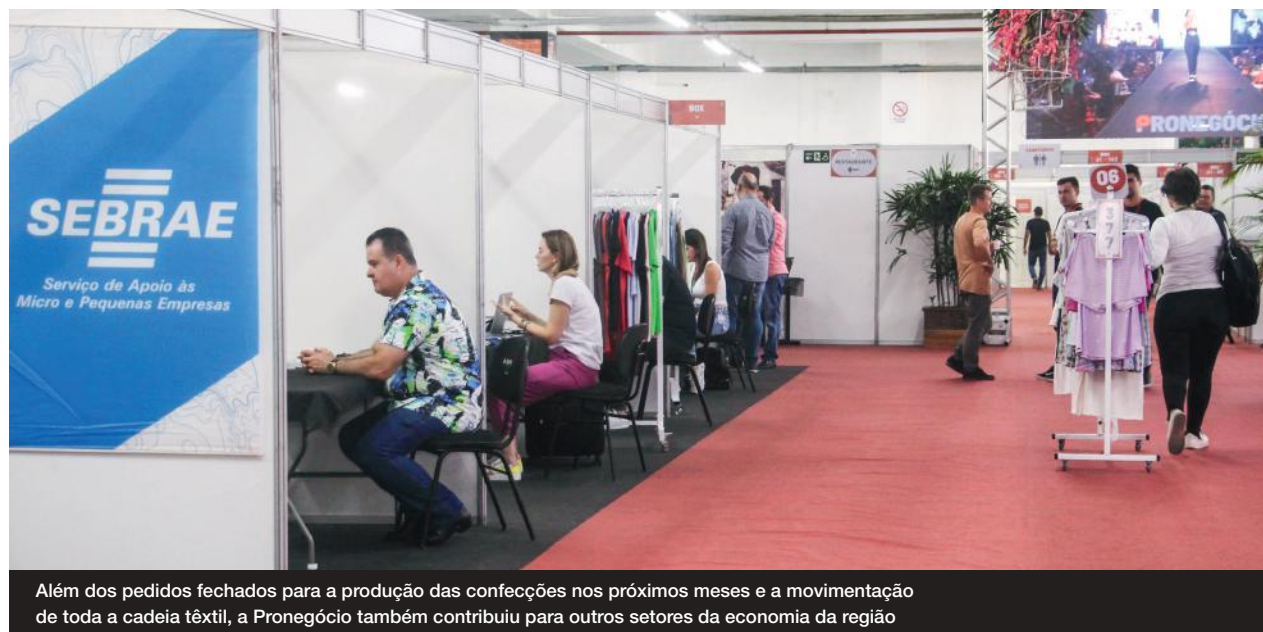
Além dos pedidos fechados para a produção das confecções nos próximos meses e a movimentação de toda a cadeia têxtil, a Pronegocio também contribuiu para outros setores da economia da região

Outro destaque da 62ª Pronegocio foi a utilização do sistema de QR Code no showroom do evento, aderido e aprovado pelos compradores.