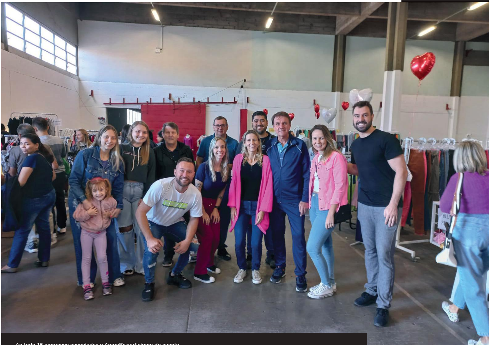
Ao todo 15 empresas associadas a AmpeBr participam do evento