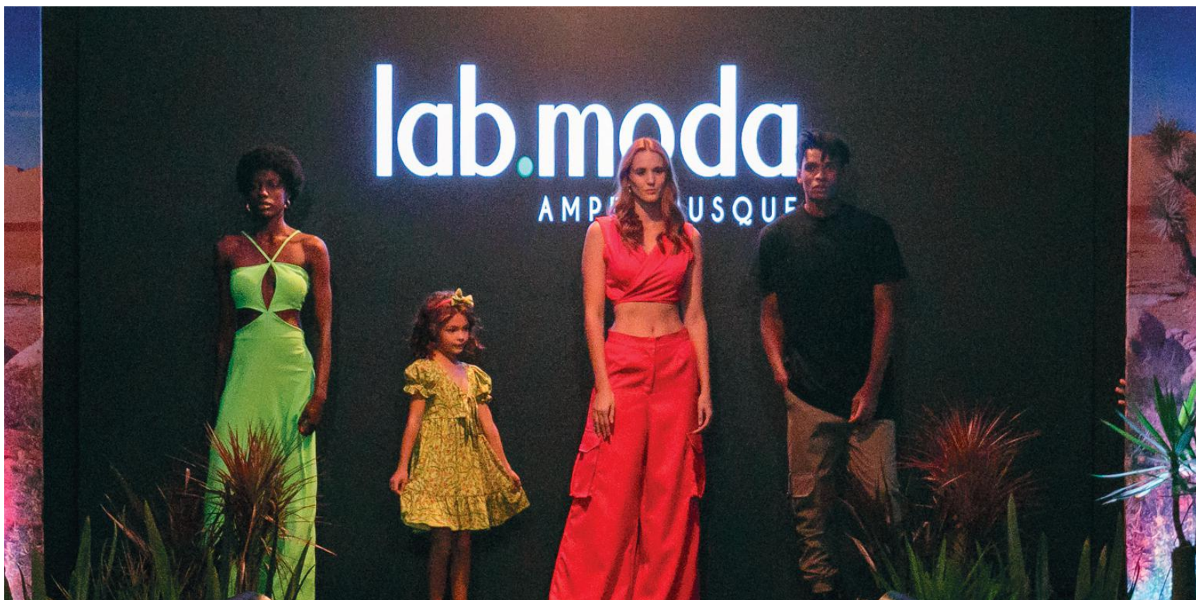
O LAB Moda da AmpeBr, também apresentou looks desenvolvidos desde o desenho até a peça piloto, mostrando os serviços de desenvolvimento que a AmpeBr oferece